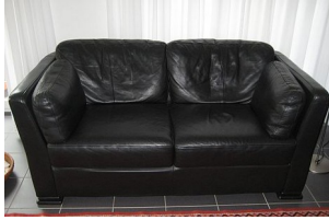
das Sofa – die Sofas