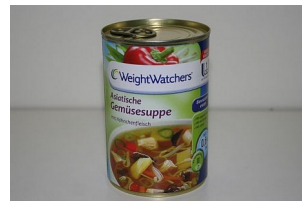
die Dose – die Dosen