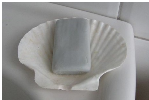
die Seife – die Seifen