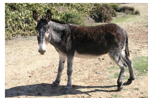
der Esel – die Esel