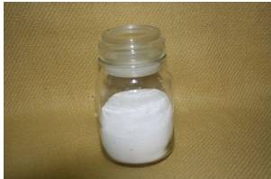
das Salz – die Salze