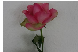
die Rose – die Rosen