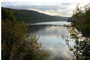
der See – die Seen