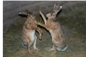
der Hase – die Hasen