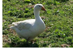
die Gans – die Gänse