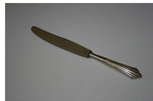
das Messer – die Messer